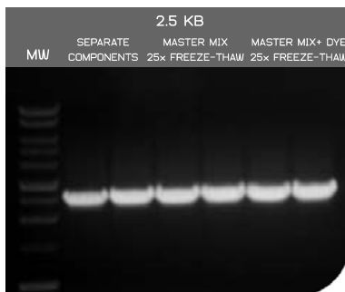
Abb. 1: PCR Amplifikation unter Verwendung von EURx Color Opti Taq PCR Master Mix (2x).

Lagerung bei -20°C (langfristig, über 12 Monate haltbar) oder bei +4°C bis zwei Monate.