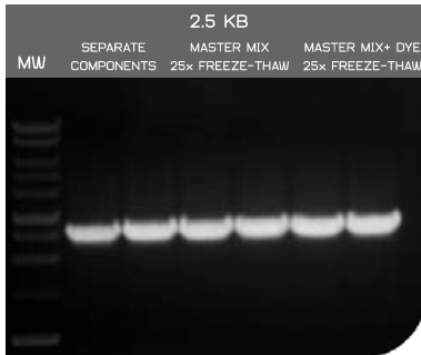
Abb. 1: PCR Amplifikation unter Verwendung von EURx Perpetual Opti Taq PCR Master Mix (2x).

Lagerung bei -20°C (langfristig, über 12 Monate haltbar) oder bei +4°C bis zwei Monate.